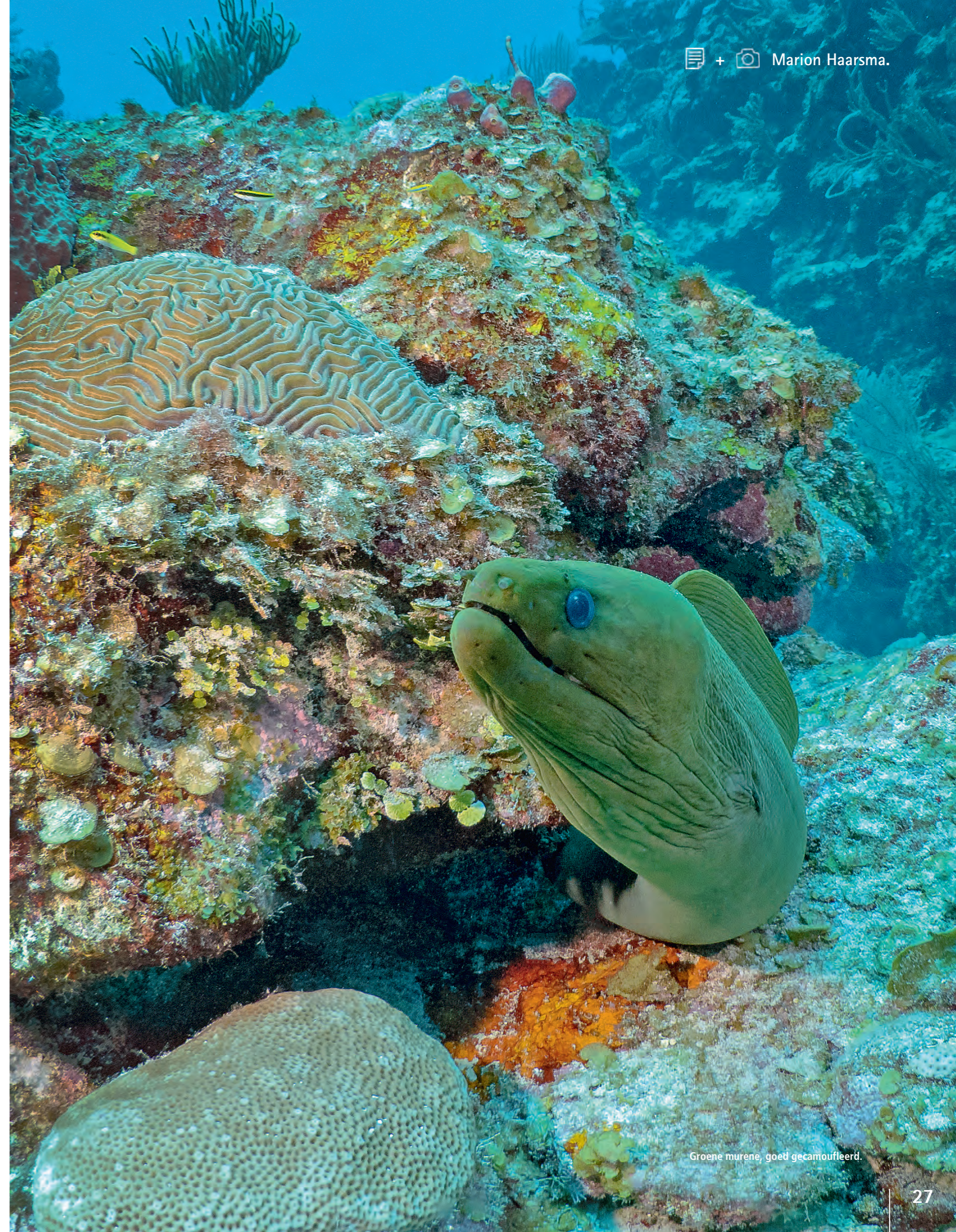
Groene murene, goed gecamoufleerd.

Na een prachtige reis met de Belize Aggressor wilde ik graag een keer terug naar Belize. Belize is een klein land aan de Caribische Zee, ingeklemd tussen Mexico en Guatemala. Het is zo groot als Nederland maar met veel minder inwoners. Vroeger was het een Engelse kolonie en heette het Engels Honduras. De inwoners spreken allemaal Engels en de tweede taal is Creools. De oorspronkelijke bewoners stammen af van de Maya's. De bevolking is enorm divers. Iedereen heeft een andere afkomst en daar zijn ze trots op. Belize ligt maar twee uur vliegen van Houston dus voor Amerikanen is