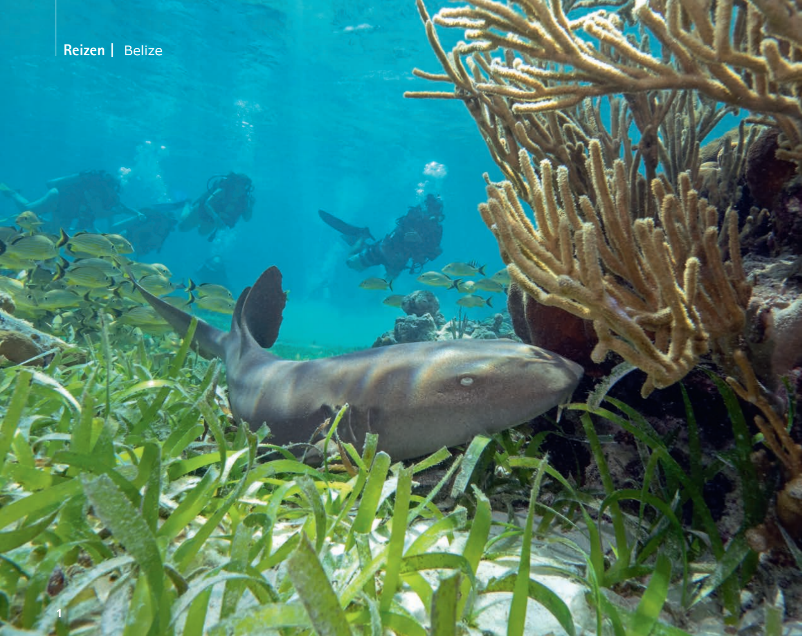
1. Een haai zwemt recht op me af en gaat rustig op het zand liggen. 2. De speedboot aan een piertje op het strand is een paar stappen lopen. 3. Een van mijn leukste ervaringen met haaien ooit. 4. San Pedro is is een stadje met wat reuring. 5. Dit uitzicht verveelt nooit.